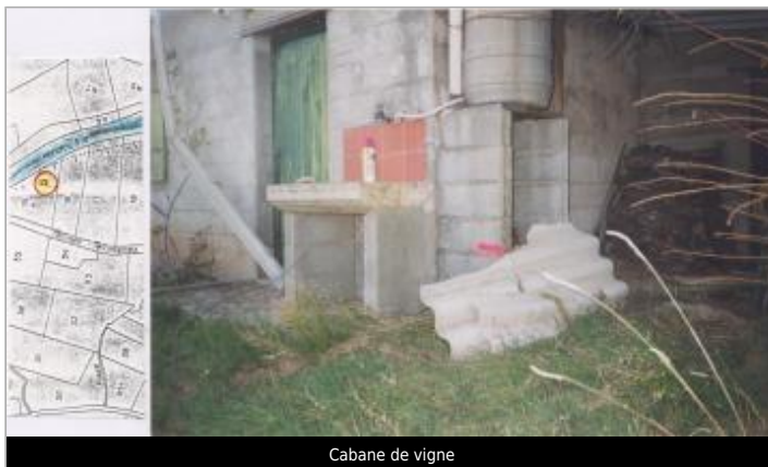
Cabane de vigne

GÉOLOCALISATION Coordonnées WGS84 : X: 2.72363660 / Y: 42.89498000 Coordonnées RGF93 (Lambert 93) X: 677404.1 / Y: 6199545.33 Coordonnées RGF93 (ETRS89) : X: 2.7236366 / Y: 42.89498 Code Hydro: Y0650500 Rive de référence: