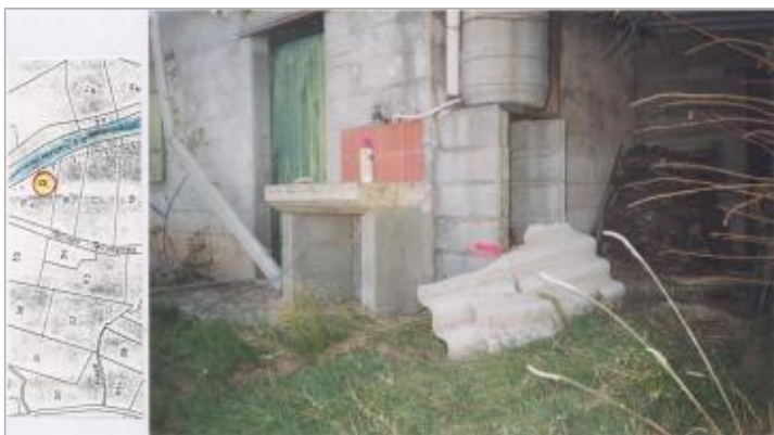
Cabane de vigne

ENQUÊTE DDE - 06/12/1999 Système altimétrique : NGF IGN 1969 (système normal) Altitude de la référence (en m) : 157.050 m Différence entre le niveau d'eau et la référence (en m) : 0.400 m Altitude calculée de l'eau (en m) : 157.45