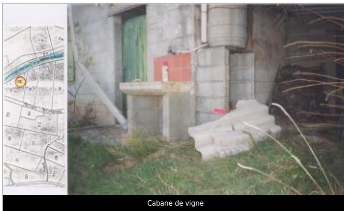
Cabane de vigne

GÉOLOCALISATION Coordonnées WGS84 : X: 2.72363660 / Y: 42.89498000 Coordonnées RGF93 (Lambert 93) X: 677404.1 / Y: 6199545.33 Coordonnées RGF93 (ETRS89) : X: 2.7236366 / Y: 42.89498 Code Hydro: Y0650500 Rive de référence: