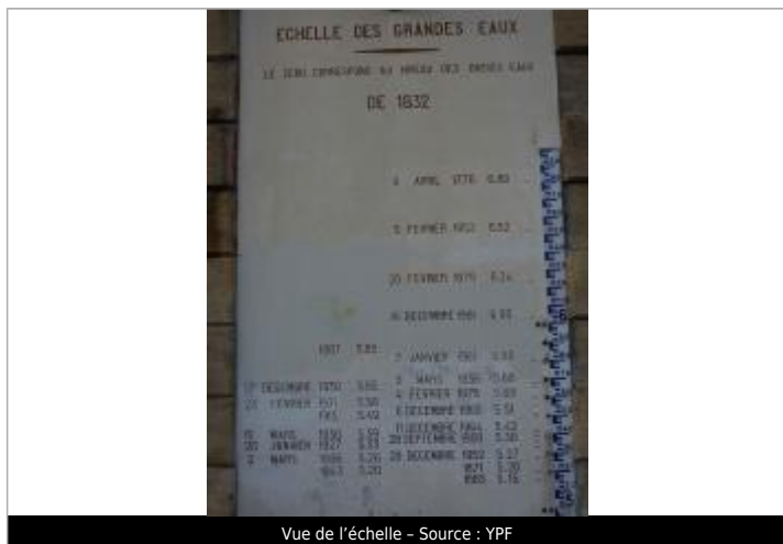
Vue de l'échelle

Différence entre le niveau d'eau et la référence (en m) : 5.200 m