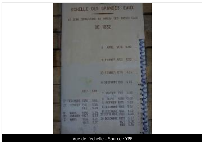
Vue de l'échelle

Différence entre le niveau d'eau et la référence (en m) : 5.260 m