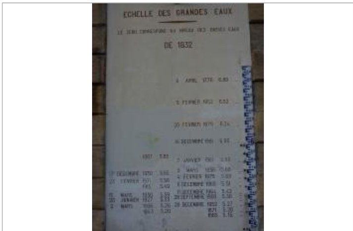
Vue de l'échelle - Source : YPF

GÉNÉRAL Code : WEB_2018_R_03_01_10 Date de mise à jour : 30/08/2021 Auteur : gestionnaire_SCVigicruces