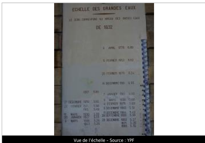
Vue de l'échelle

Différence entre le niveau d'eau et la référence (en m) : 5.600 m