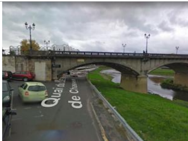
Vue du site - Source : Google Street View (2010)