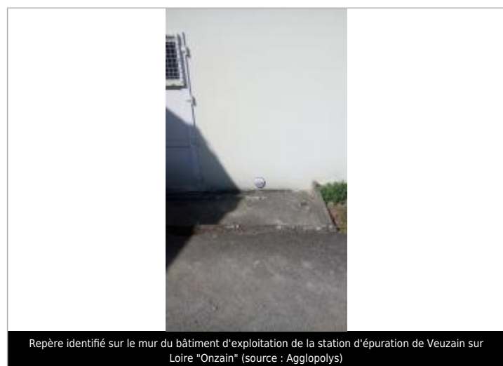
Repère identifié sur le mur du bâtiment d'exploitation de la station d'épuration de Veuzain sur Loire "Onzain"

MARQUE Texte : 1er juin 2016 - Niveau atteint par les eaux - La Cisse Maximum de l'inondation : Oui Visibilité : Oui