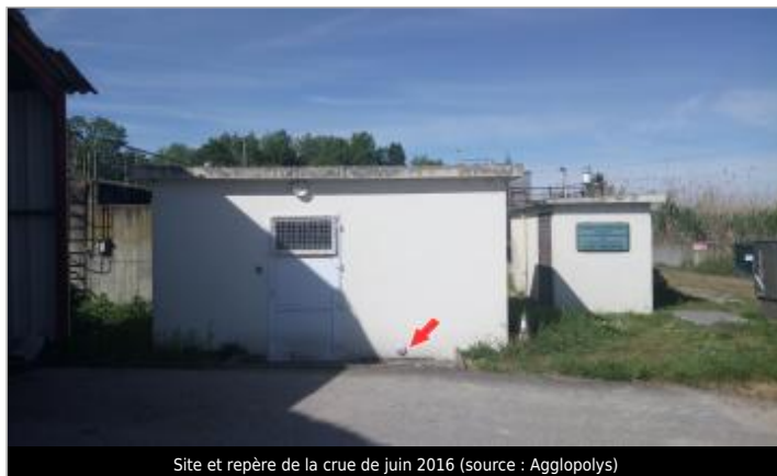
Site et repère de la crue de juin 2016

GÉOLOCALISATION Coordonnées WGS84 : X: 1.17994460 / Y: 47.49474700 Coordonnées RGF93 (Lambert 93) X: 562979.22 / Y: 6712066.31 Coordonnées RGF93 (ETRS89) : X: 1.1799446 / Y: 47.494747 Code Hydro: K4--0150 Rive de référence: Gauche