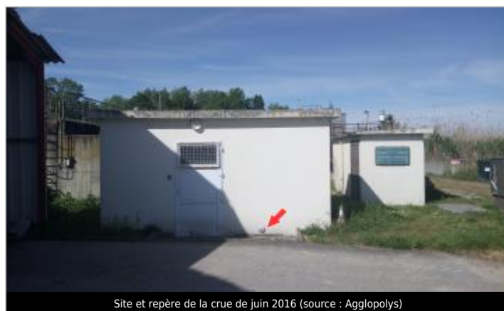
Site et repère de la crue de juin 2016

GÉOLOCALISATION Coordonnées WGS84 : X: 1.17994460 / Y: 47.49474700 Coordonnées RGF93 (Lambert 93) X: 562979.22 / Y: 6712066.31 Coordonnées RGF93 (ETRS89) : X: 1.1799446 / Y: 47.494747 Code Hydro: K4-0150 Rive de référence: Gauche