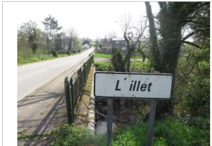
Vue du pont de la RD 25