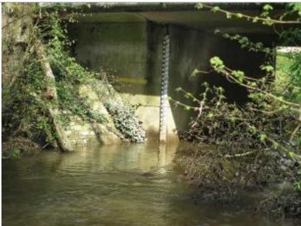
Echelle limnimétrique sous le pont de la RD 25

Altitude calculée de l'eau (en m) : 42.53 m