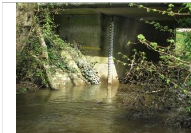
Echelle limnimétrique sous le pont de la RD 25

Altitude calculée de l'eau (en m) : 42.53 m