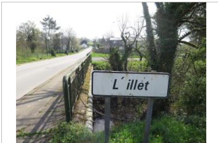
Vue du pont de la RD 25