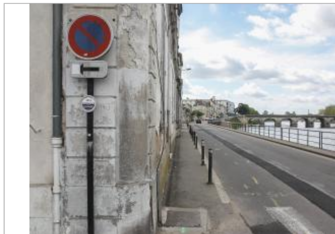
Angle rue Roffay et quai du Château