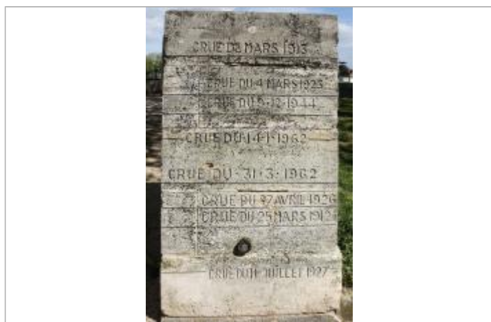
Borne à la Manu

Organisme : Etablissement public du bassin de la Vienne