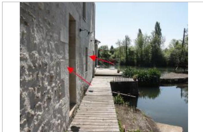
Façade amont - moulin de Souhé