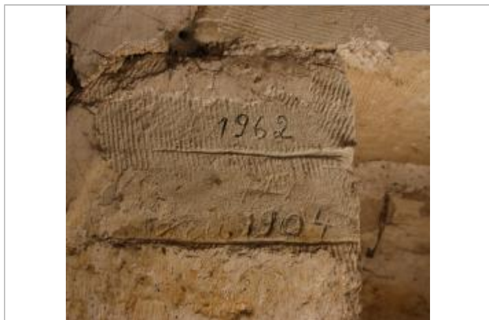
Marques 1904 et 1962 (janvier)

Texte : 1962 Maximum de l'inondation : Non renseigné Visibilité : Non État du repère : Bon Pérennité : Longue Repère calculé : Non PHEC : Non