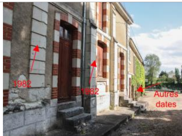
Marques sur bâtiment annexe près du moulin des Bordes