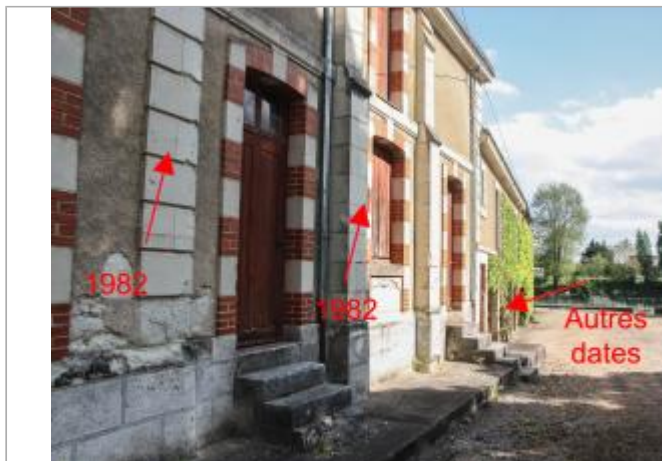
Marques sur bâtiment annexe près du moulin des Bordes