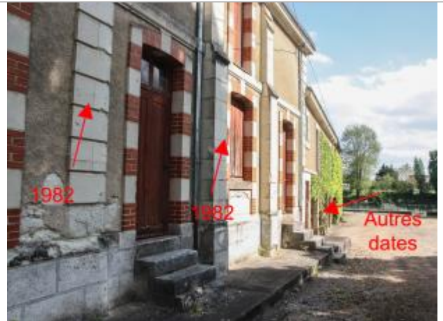
Marques sur bâtiment annexe près du moulin des Bordes