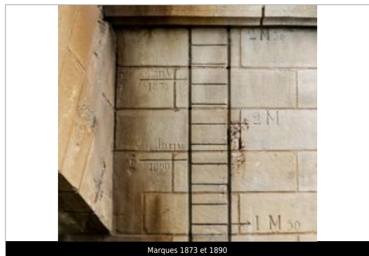
Marques 1873 et 1890

MARQUE Texte : Janv 1873 Maximum de l'inondation : Non renseigné Visibilité : Oui État du repère : Bon Pérennité : Longue Repère calculé : Non PHEC : Non