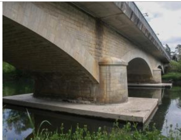
Pile du pont à Domine - rive gauche