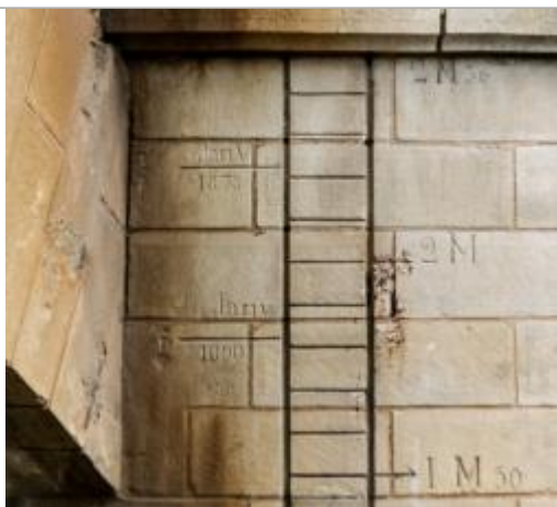
Marques 1890 et 1870

SOURCE DE REPÉRAGE : RECENSEMENT DES REPÈRES DE CRUES PAR L'EPTB VIENNE - PHASE OPÉRATIONNELLE DU PAPI VIENNE AVAL - 09/04/2018