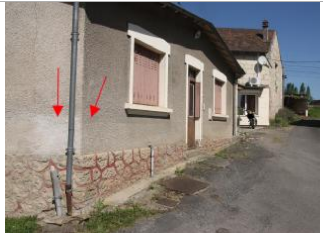
Traces au n°11 (1)

Coordonnées WGS84 : X: 0.50630872 / Y: 46.76684500