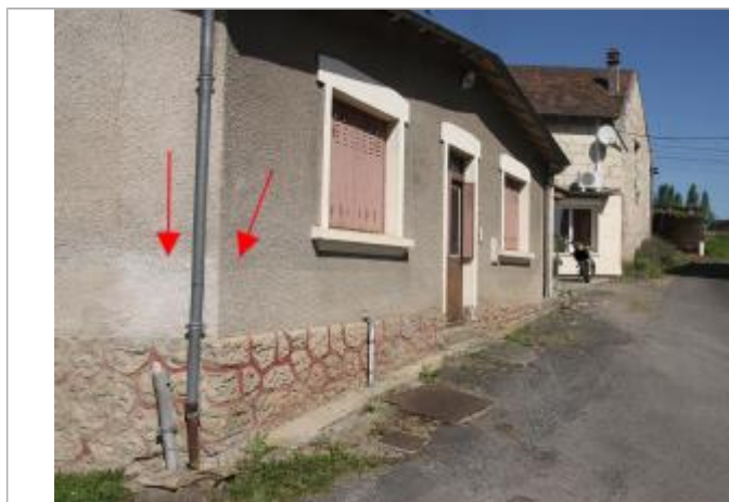
Marque au n°11 (1)

Méthode : GPS Organisme : Etablissement public du bassin de la Vienne Commentaires sur le nivellement : Nivellement rattaché au NGF par application du RAF09 (réseau Téria). Référence nivelée : Marque d'inondation Système altimétrique : NGF IGN 1969 (système normal) Altitude de la référence (en m) : 54.410 m Altitude calculée de l'eau (en m) : 54.41