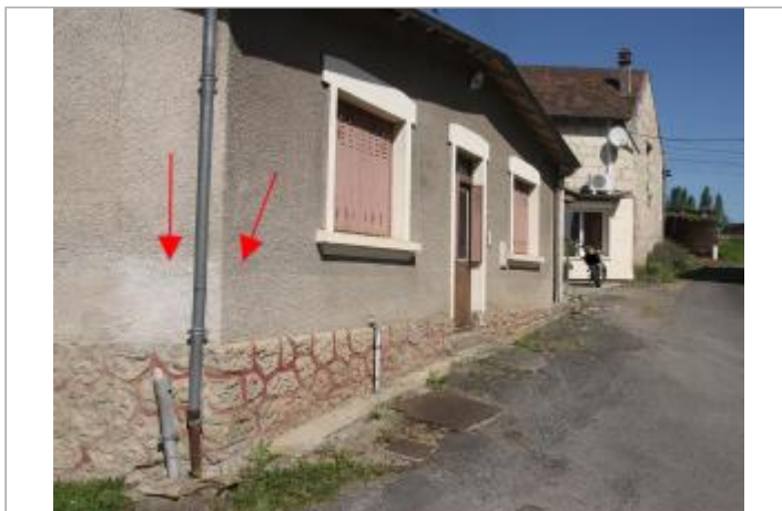
Traces au n°11 (1)