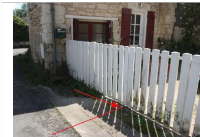
Niveau 1982 rue François Villon

Type de repérage : Campagne de terrain post-inondation Organisme : Etablissement public du bassin de la Vienne