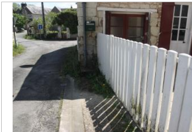
Portail au n°10 rue François Villon