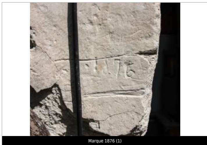
Marque 1876 (1)

Organisme : Etablissement public du bassin de la Vienne