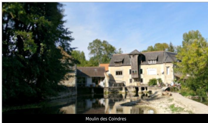
Moulin des Coindres