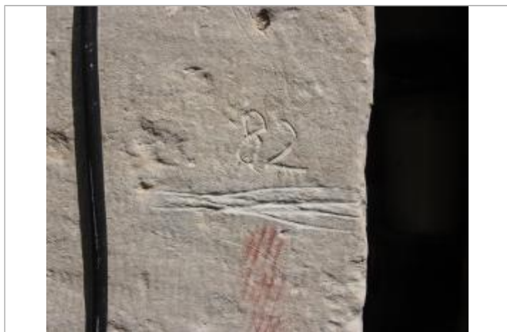
Marque 82 (1)