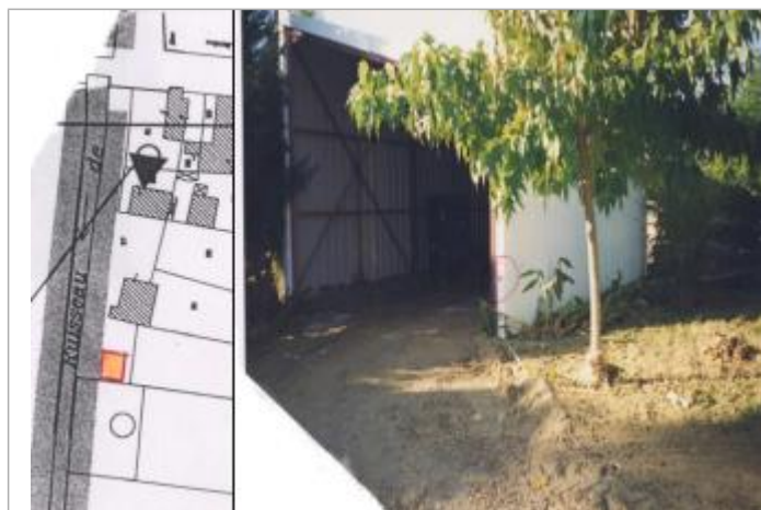
encadrement métallique de hangar

Altitude calculée de l'eau (en m) : 132.38 m