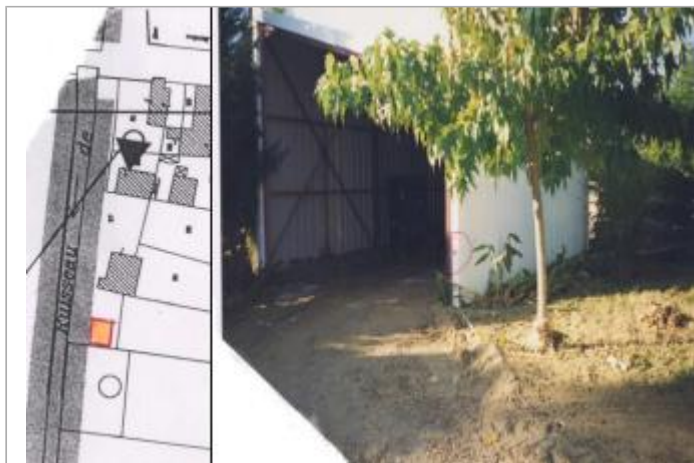
Encadrement métallique de hangar