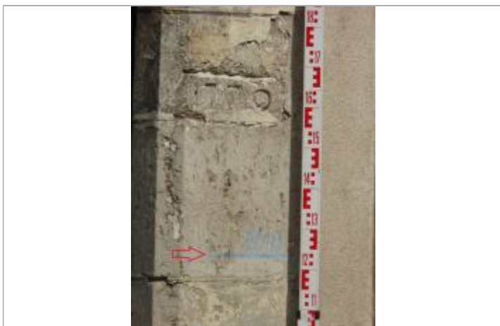
Vue de la marque