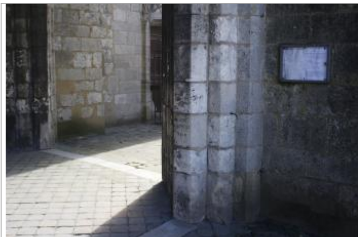
Pilier droit du porche de l'église St-Jean-Baptiste de Nemours