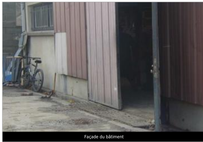
Façade du bâtiment

Coordonnées RGF93 (ETRS89) : X: 2.3612339 / Y: 43.18364