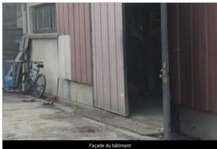
Façade du bâtiment

Altitude calculée de l'eau (en m) : 132.69 m