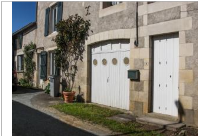
Site au 4 impasse du moulin (1)