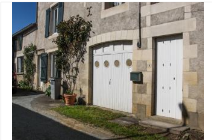
Site au 4 impasse du moulin (1)

GÉOLOCALISATION Coordonnées WGS84 : X: 0.63402521 / Y: 46.50811500 Coordonnées RGF93 (Lambert 93) : X: 518608.13 / Y: 6603618.97 Coordonnées RGF93 (ETRS89) : X: 0.6340252 / Y: 46.508115 Code Hydro: L---0060 Rive de référence: Droite