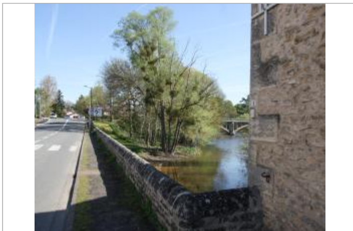
Site du moulin rive gauche (1)