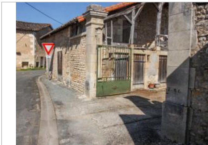
Pilier rue de traverse (1)