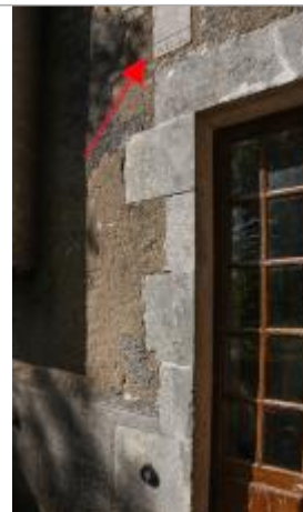
Entrée du moulin

Code Hydro : L---0060 Rive de référence : Droite