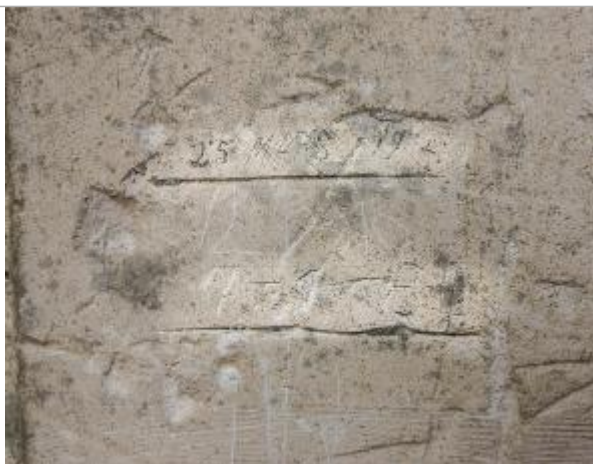
Marques 1912 et 1982