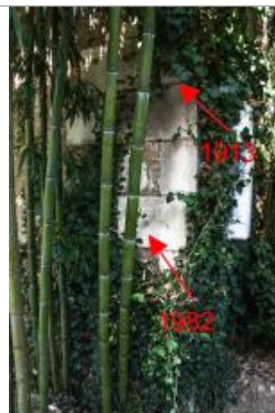
Marques au Moulin Milon (1)