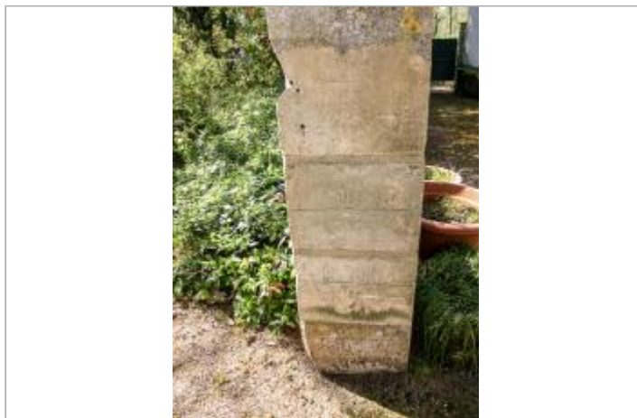
Pilier de jardin au moulin Brault