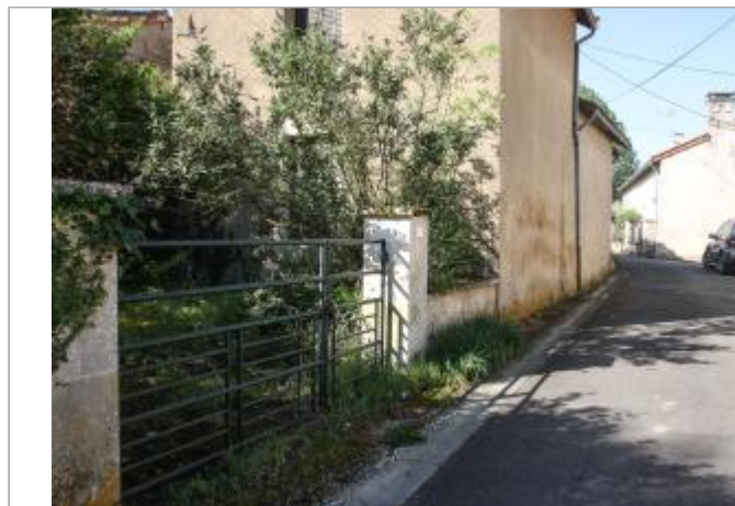
Site des pêcheurs (1)