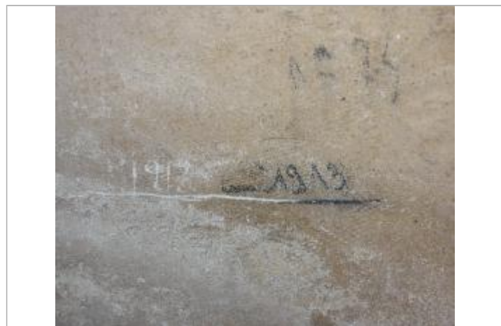
Marque 1913 à l'intérieur