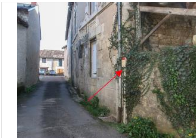
Site rue de la Tour de Galles (1)