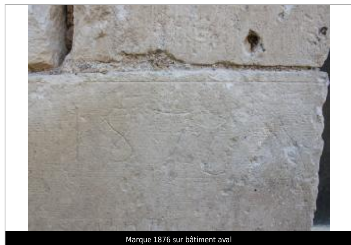
Marque 1876 sur bâtiment aval