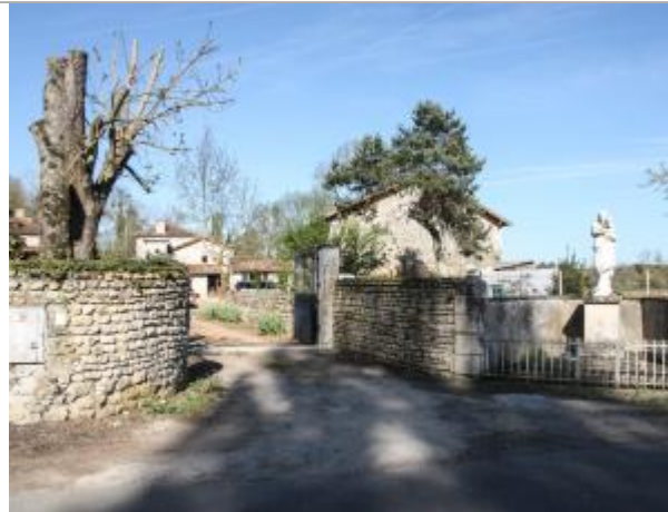
Entrée du site - impasse du moulin de Chabanne