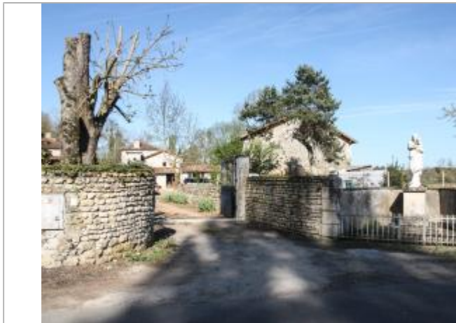
Entrée du site - impasse du moulin de Chabanne