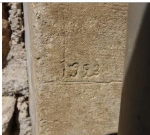
Première marque 1923