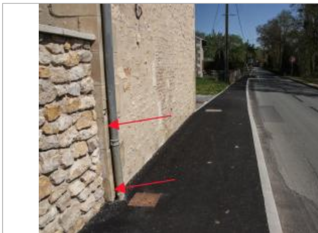
Marques au 20 rue de Bonneuil (1)