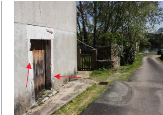
Marques à la Prunerie (1)