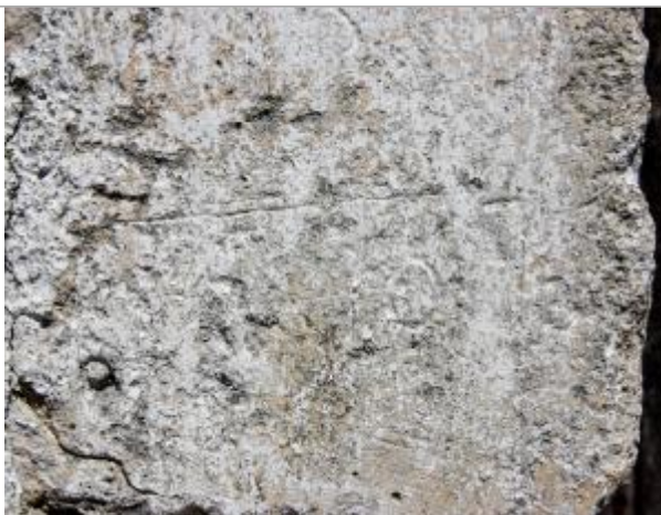
Marque haute de 1876

Organisme(s) : Etablissement public du bassin de la Vienne