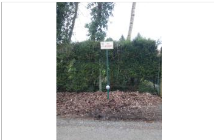
site du repère