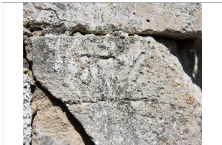
Marque basse de 1876

Altitude calculée de l'eau (en m) : 68.04 m