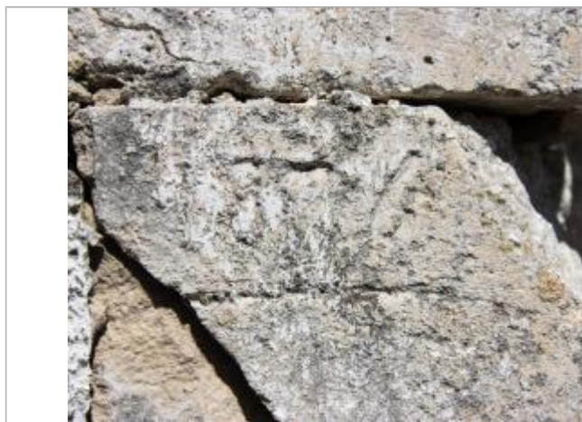
Marque basse de 1876

Altitude calculée de l'eau (en m) : 68.04 m