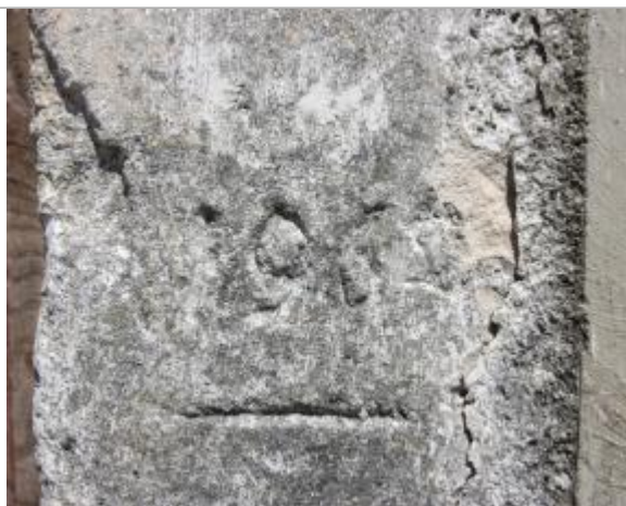
Marque haute de 1962

Altitude calculée de l'eau (en m) : 67.84 m