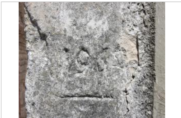
Marque haute de 1962

Altitude calculée de l'eau (en m) : 67.84 m