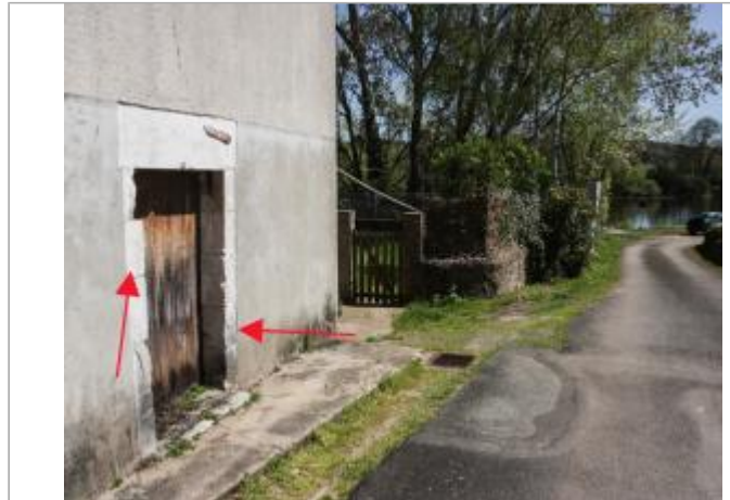
Marques à la Prunerie (1)