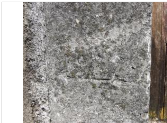
Marque basse de 1962

SOURCE DE REPÉRAGE : RECENSEMENT DES REPÈRES DE CRUES PAR L'EPTB VIENNE - PHASE OPÉRATIONNELLE DU PAPI VIENNE AVAL - 09/04/2018