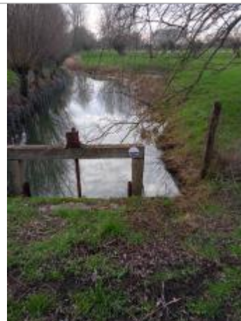
site du repère

Coordonnées RGF93 (ETRS89) : X: 2.589316 / Y: 50.634115