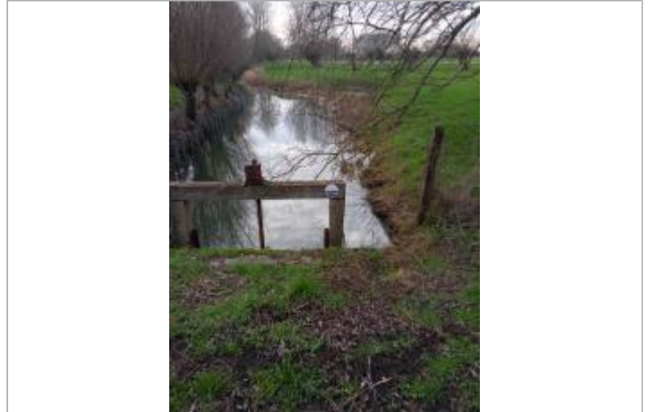
site du repère