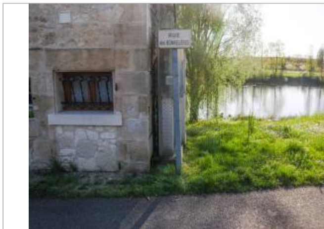
Maison au moulin Bouin (1)