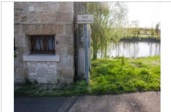
Maison au moulin Bouin (1)