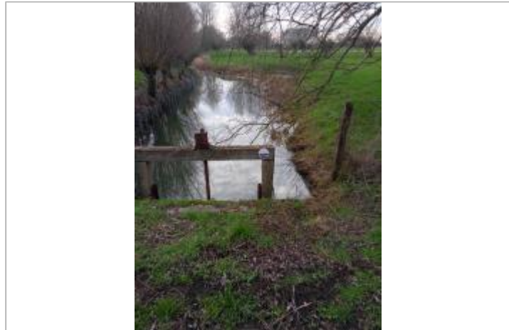
site du repère