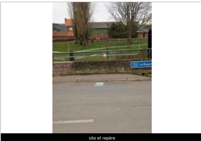
site et repère

GÉOLOCALISATION Coordonnées WGS84 : X: 2.49056461 / Y: 50.42813360 Coordonnées RGF93 (Lambert 93) X: 663749.42 / Y: 7036850.71 Coordonnées RGF93 (ETRS89) : X: 2.4905646 / Y: 50.4281336