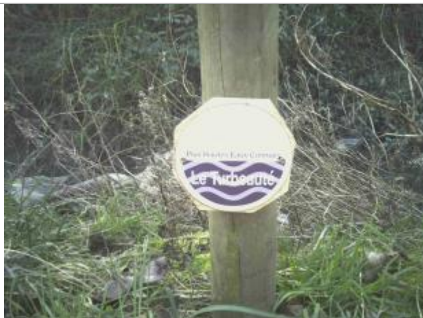
repère de crue