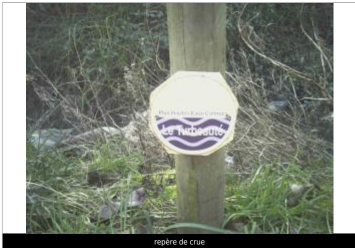
repère de crue

Maximum de l'inondation : Oui Visibilité : Oui État du repère : Bon Pérennité : Longue Repère calculé : Non PHEC : Oui